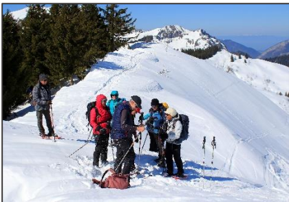
19/03/26 –Chalets de Lens- Bassachaux