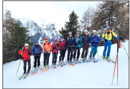
Du 7 au 14/03 – Séjour à Pelvoux