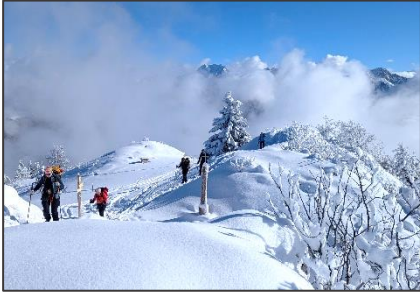
29/01/26 – Pointe de Miribel