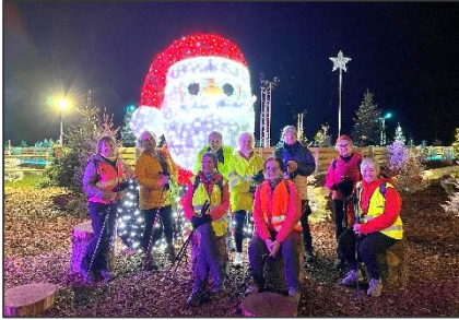
10/12/25 – Nocturne marche nordique