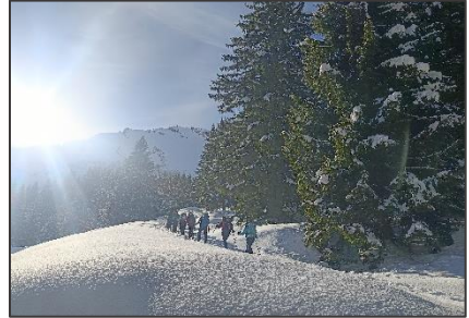
01/02/26 Sortie des rescapés : La Chaila