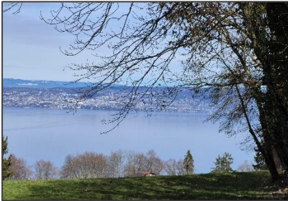
Du 22/02/26 – Champanges-Larringes