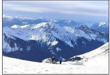
18/01/26 – Col du Fornet