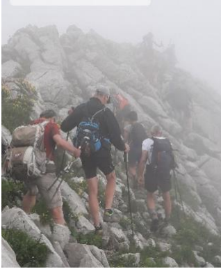
Brouillard sur l'arête Bise